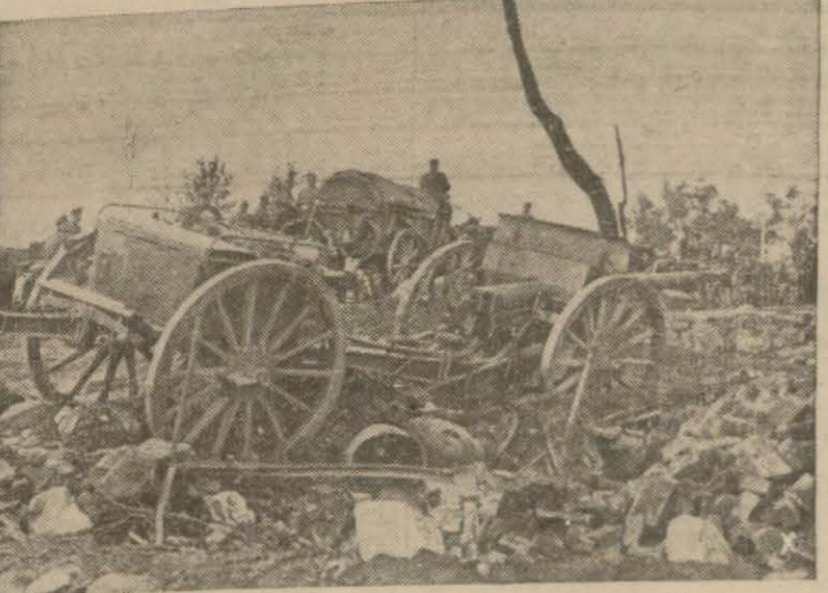
Ruslar tarafından yollara bırakılan harb malzemesi