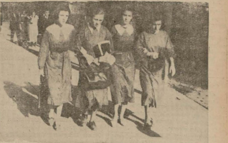
Bu sabah sokaklarda görülen mektebli kaffeieri

Şehrimizdeki resmi ve hususi orta tedrisat müesseselerinde bu sabahdan itibaren tedrisata başlanmıştır. İlkokulların açılmasına aid hazırlıklara da devam edilmektedir. İlkokullarda ayın 29 uncu Pazartesi sabahından itibaren derslere başlanacaktır.