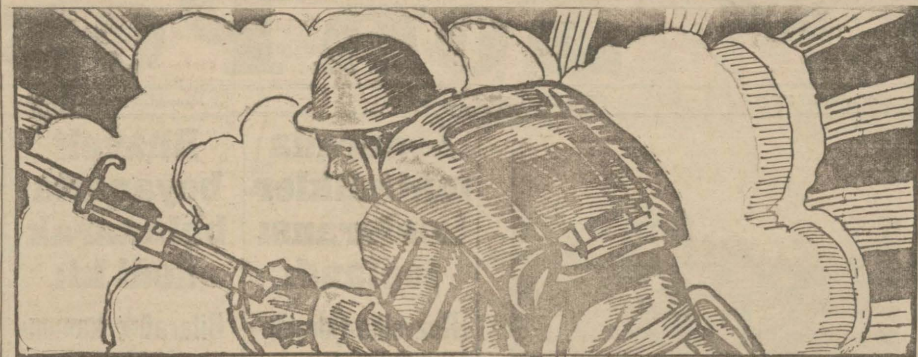
Çok dövüşen bir millet yalnız kanından kaybeder.